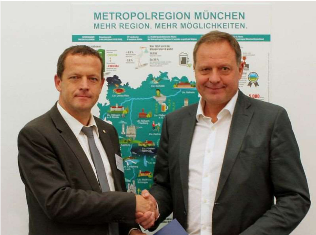
AN DREES & SOMMER ZUSAMMEN MIT HENDRICKS & SCHWARTZ