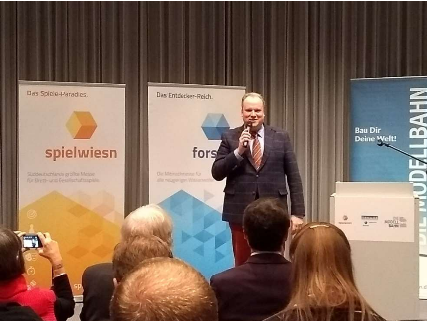
EMM E.V. KOOPARATIONSPARTNER DES LANDKREISES MÜNCHEN