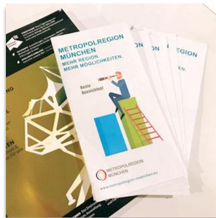
> Poster der Metropolregion München