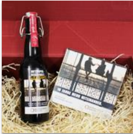
> Jubiläumsbier und CD mitsamt Booklet als Rückblick auf 10 Jahre EMM e.V.