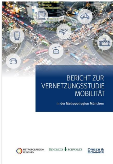
> Bericht zur Vernetzungsstudie