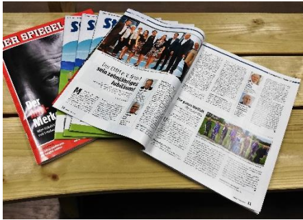
> Spiegelbeilage - Bayern Starkes Land