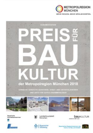
> Dokumentation und Wanderausstellung zum Preis für Baukultur 2018