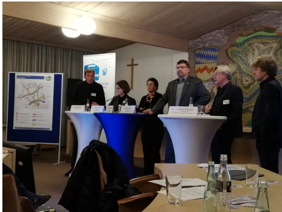
Zur Eröffnung der Wanderausstellung zum Preis für Baukultur hat der Landkreis Dachau gemeinsam mit der Landeshauptstadt München und dem EMM e.V. zur Veranstaltung „Wachstum mit Qualität ,zwischen Dorf und Metropole“ eingeladen.