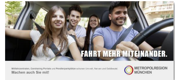
> Postkarte zur Bewerbung der Sammlung von Mitfahrzentralen, Carsharing-Portalen und Pendlerparkplätze in der Metropolregion