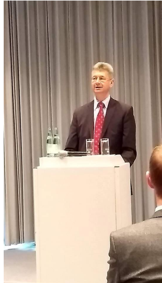
Der EMM e.V. war auch in diesem Jahr wieder Unterstützer des Gemeinschaftsstandes der MINT-Region Münchner Umland (Landkreis München und Landkreis Dachau).