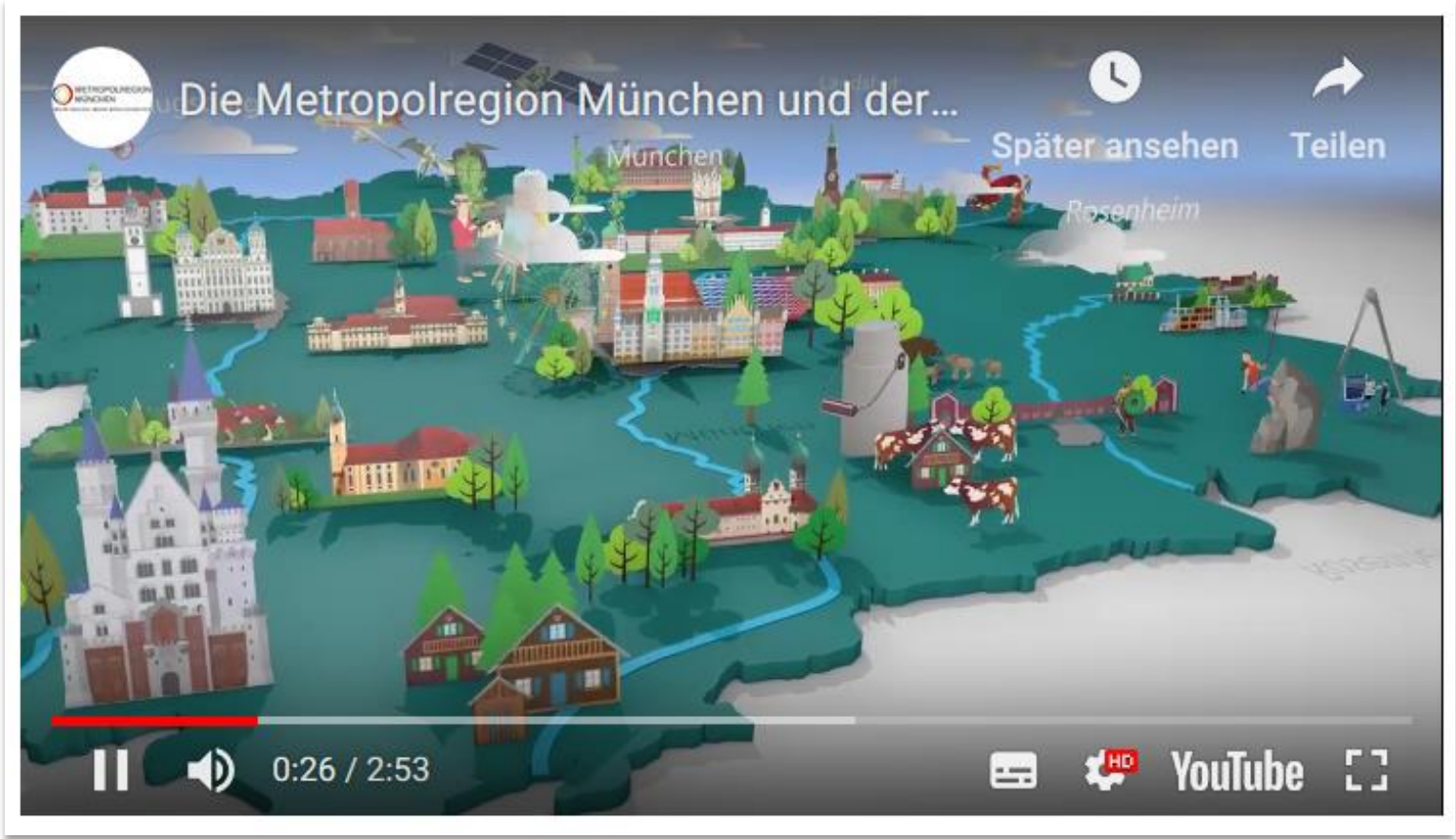
> Erklärvideo „Was ist eigentlich die Metropolregion München?“ zu Verein und Region