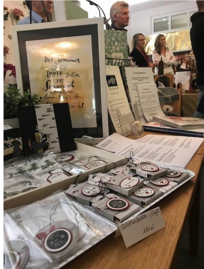
Der EMM e.V. hat 2018 in Wolfratshausen, Bad Tölz und Holzkirchen die Einrichtung von Pop-up-Stores unterstützt, um die Kultur- und Kreativwirtschaft der Region zu stärken.