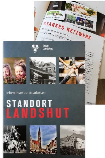
Standortbroschüre der Stadt Landshut