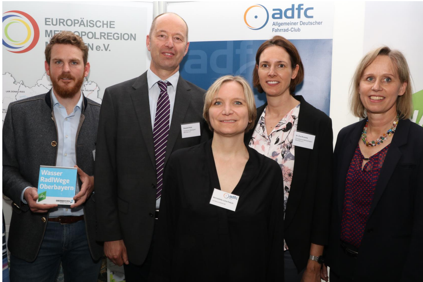
Der EMM e.V. war Unterstützer des ADFC Mittagsgesprächs. Dort wurde die Forderung nach einem Rad-Gesetz für Bayern sowie die WASSERRADLWEGE Oberbayern vorgestellt.